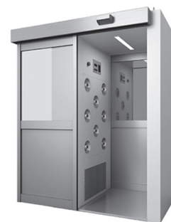
図2 エアシャワーの例